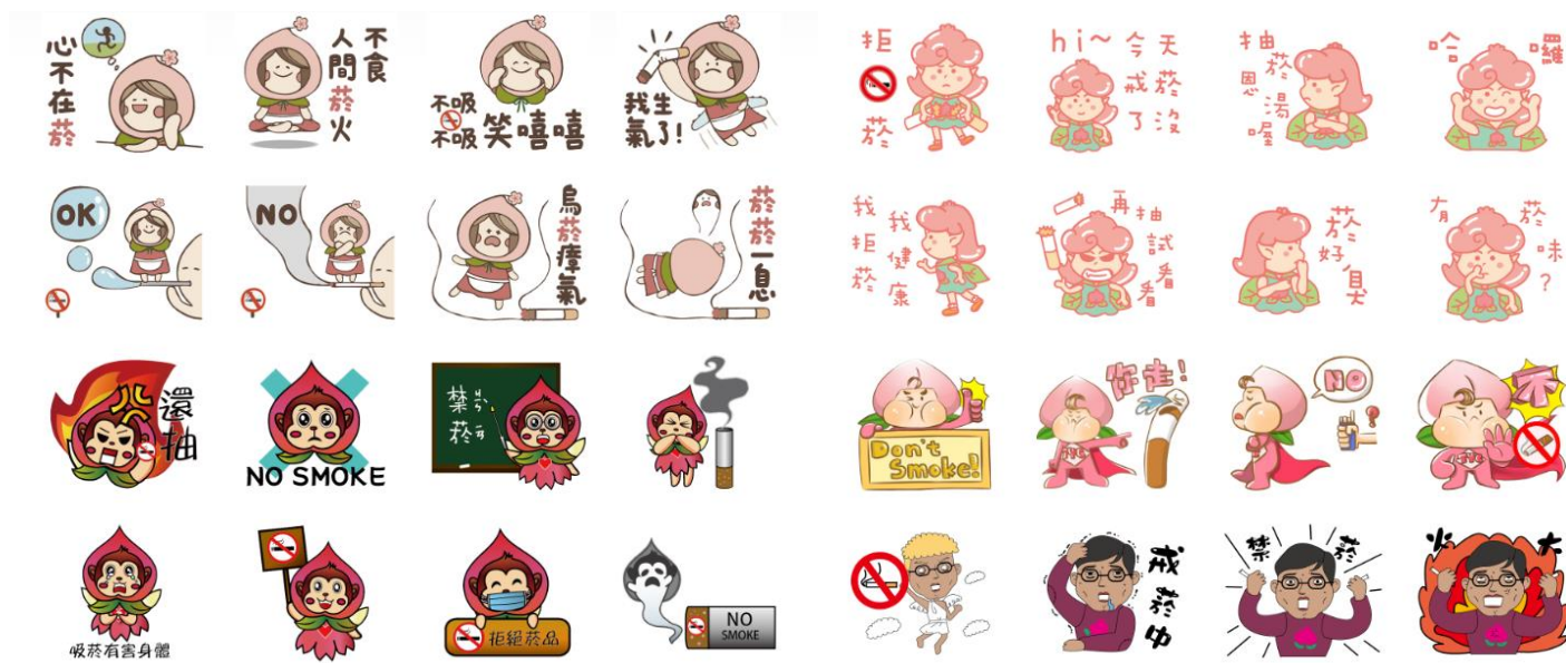
圖 2.禁菸 Line 貼圖圖樣